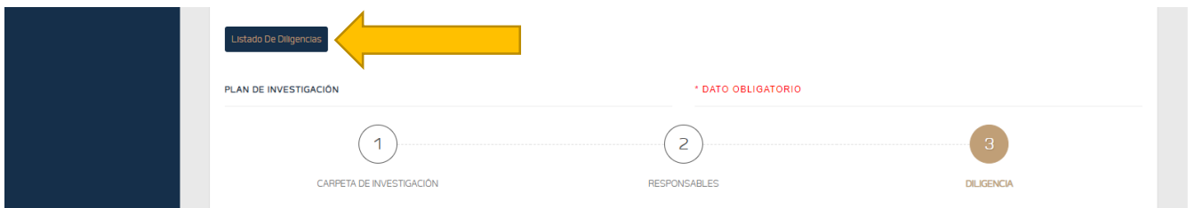
Ilustración 1.9 Manual regresar a listado