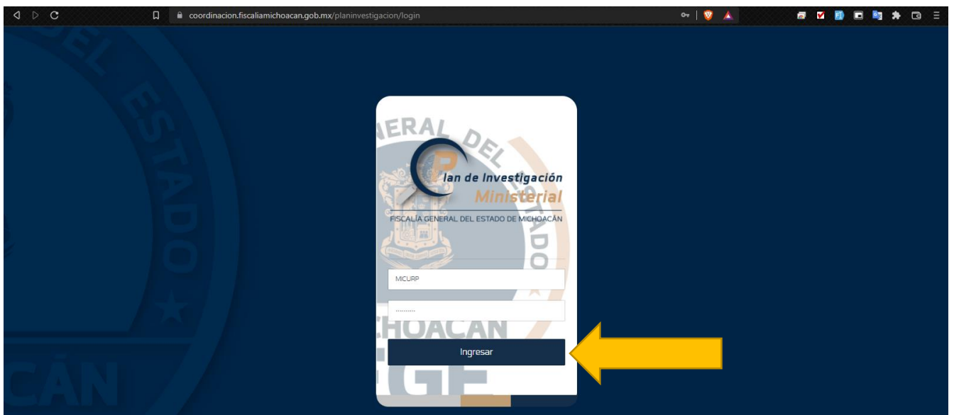
Ilustración 1.1 Manual vista login

se ingresa la CURP y la contraseña de los sistemas de identidad digital o declara y presiona el botón de ingresar . Ilustración 1.1