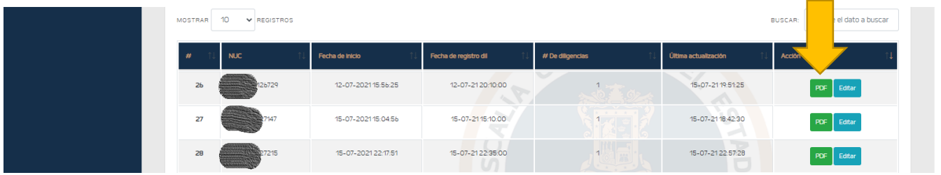
Ilustración 1.10 Manual imprimir PDF

g) Imprimir PDF. Para descargar el archivo se tiene que presionar el botón llamado PDF y deberá de descargar para imprimirlo y anexarlo al expediente. (Si no aparece el botón PDF es porque no está completa la información registrada. Hay que repetir desde el inciso c). ilustración 1.10